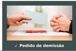
Pedido de demissão