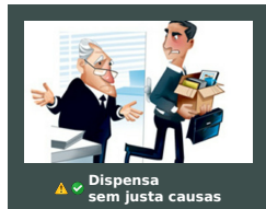
Dispensa sem justa causas