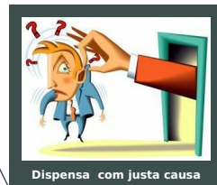
Dispensa com justa causa