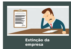
Extinção da empresa